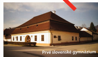
Prvé slovenské gymnázium