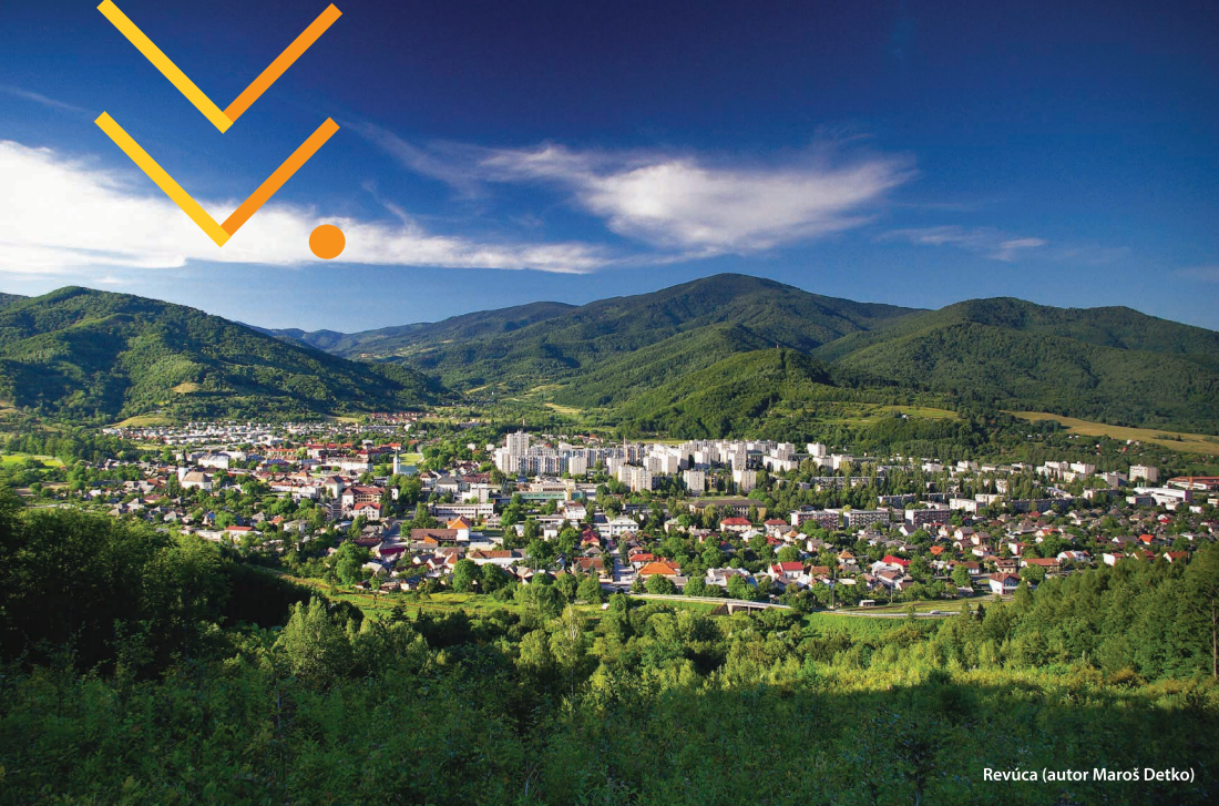
Revúca

Doprajte si zaslúžený oddych v blízkosti nádhornej prírody a historických pamiatok mesta REVÚCA . Jej okolie oplýva miestami, ktoré potešia nejedného návštevníka s dušou turistu i s chuťou prebádať jeho históriu.