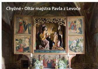
Chyžné - Oltár majstra Pavla z Levoče

Vydajte sa z Magnetizoviec spoznávať príbeh ambiciózneho mega-projektu Gemerské spojky , železničných tratí, po ktorých nikdy neprešiel vlak. Vznikli v období Slovenského štátu, kedy po Viedenskej arbitráži južná časť nášho územia pripadla Maďarsku. Mali za úlohu priamo prepojiť izolované časti Gemera v dvoch úsekoch: Tisovec - Revúca a Lubeník - Slavošovce. Po vypuknutí SNP v roku 1944 a navrátení územia Slovensku však stratili svoje opodstatnenie a stavba sa prerušila.