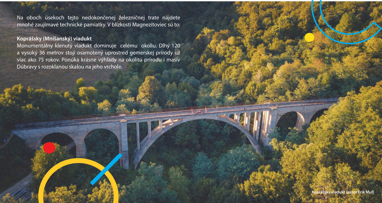
Koprášsky viadukt

Monumentálny klenutý viadukt dominuje celému okoliu. Dlhý 120 a vysoký 36 metrov stojí osamotený uprostred gemerskej prírody už viac ako 75 rokov. Ponúka krásne výhľady na okolitú prírodu i masív Dúbravy s rozoklanou skalou na jeho vrchole.