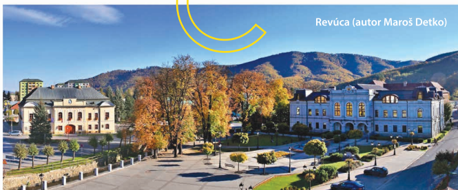
Revúca

V minulosti bola jedným z najdôležitejších centier kultúrneho a literárneho diania na Slovensku. Svedkom toho je i budova Prvého slovenského gymnázia , v ktorej dnes sídli múzeum. Jeho návšteva vás preniesie v čase priamo do lavíc, v ktorých študovali Martin Kukučín, Miloslav Hodža, Vladimír Hurban, Samuel Daxner, či Jozef Škultéty. Súčasťou gymnázia je aj Turistické informačné centrum a Záhrada národovcov , v ktorej si môžete posediť a dopriať oddych so šálkou kávy v príjemnom prostredí.