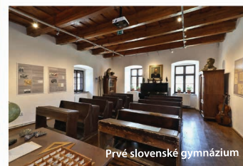
Prvé slovenské gymnázium