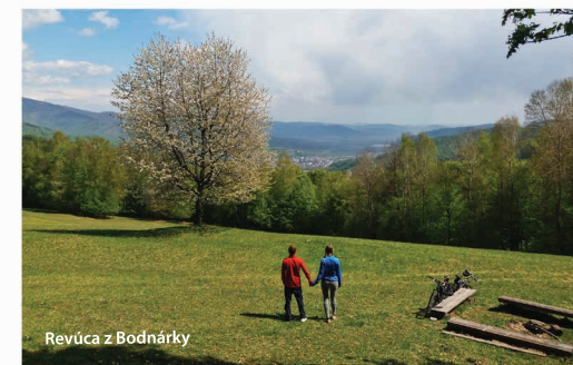
Revúca z Bodnárky