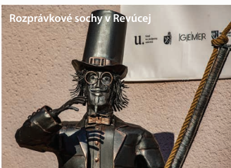
Rozprávkové sochy v Revúcej