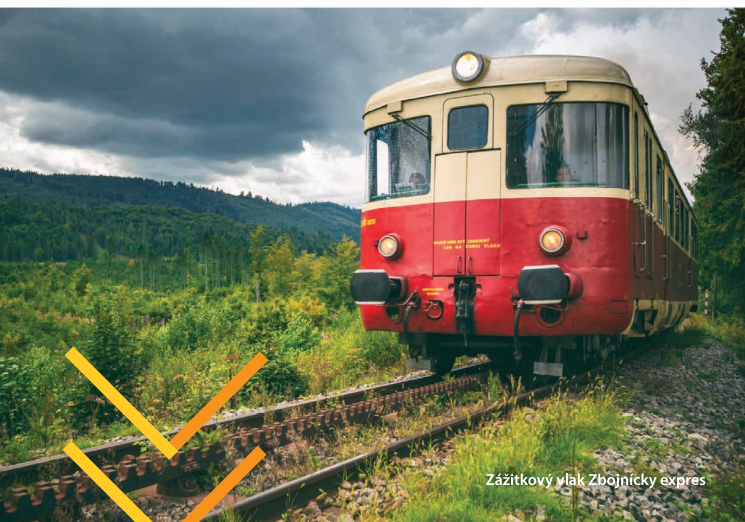
Zážitkový vlak Zbojnicky expres