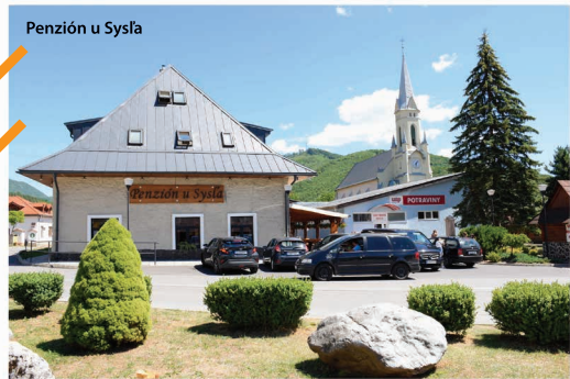
Penzión u Sysla