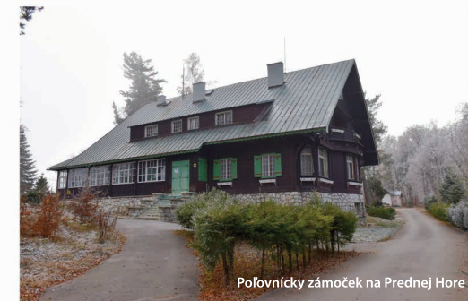
Polovnícky zámček na Prednej Hore