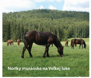
Noriky muránske na Velkej lúke

MURÁNSKA HUTA - malebná horská dedinka leží učepená v dolinke Hutníckeho potoka pri ceste z Muráňa do kraja pod Kráľovou hoľou . Vďaka svojej polohe, kludu a čistému liečivému vzduchu je rajom pre chalupárov, hubárov i turistov. Mnohí tu začínajú svoje potulky po idylickej krajinke Zdychavských lazov , iní sa vyberú cez sedlo Predná Hora na Muránsky hrad , ďalší popri vodopáde Bobačka za voľne sa pasúcimi norikmi na Velkú lúku . V obci pôsobí aj jazdecký klub Pod planinou , vďaka ktorému si možno urobiť krásne výlety do okolia v konskom sedle.