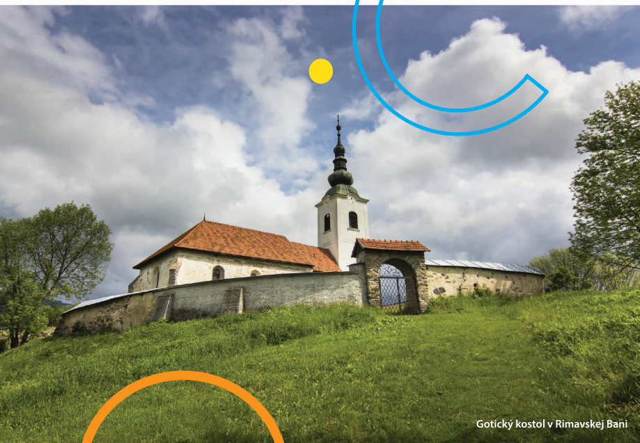
Gotický kostol v Rimavskej Bani

Dominantou obce je gotický kostol na návrší ukrývajúci krásnu freskovú výzdobu nesúcu značku Európske kultúrne dedičstvo. Pod ním začína náučný chodník SNP-Bojisko Rimavská Baňa , ktorý prevedie návštevníkov po autentických miestach, kde v dňoch 19.- 22. októbra 1944 povstalci z pešieho práporu „Narcis“ statočne odolávali nepriateľskej presile. Špecifikom chodníka sú znázornené obranné postavenia povstalcov, sochy vojakov i guľometný bunker na kôte „Hrb“. Vzhľadom na náročnosť terénu je odporúčaná pevná turistická obuv a obozretnosť obzvlášť v období po daždi.