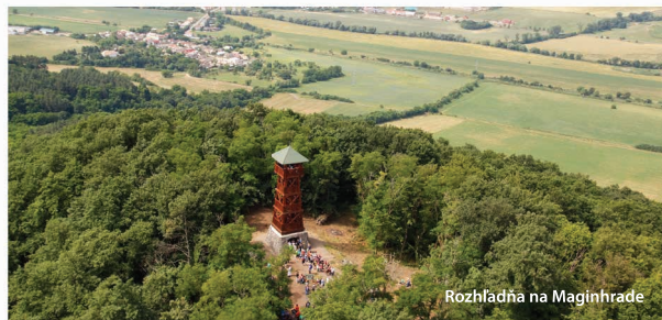
Rozhľadňa na Maginhrade