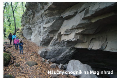
Náučný chodník na Maginhrad