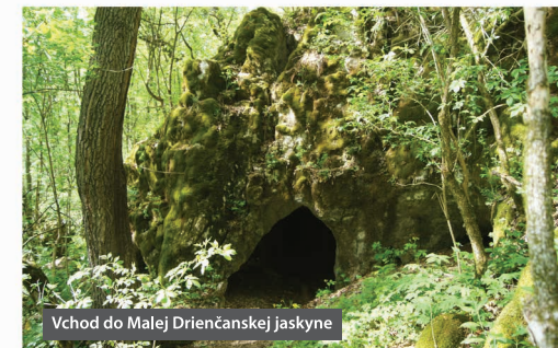
Vchod do Malej Drienčanskej jaskyne