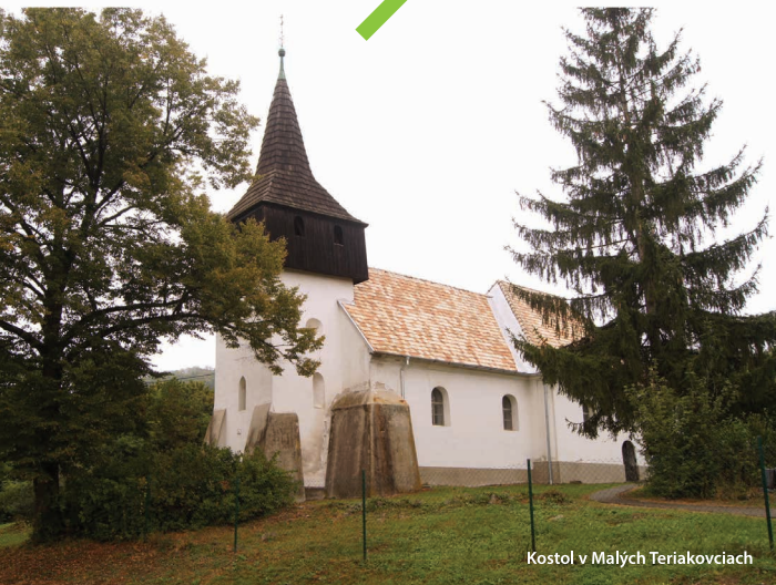
Kostol v Malých Teriakovciach