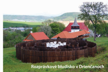
Rozprávkové bludisko v Drienčanoch