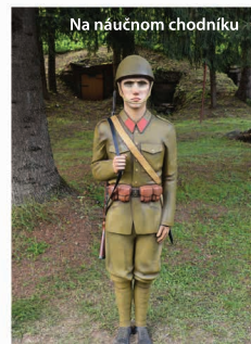
Na náučnom chodníku