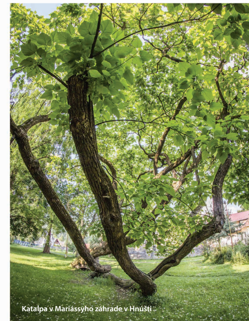
Katalpa v Mariássyho záhrade v Hnúšte