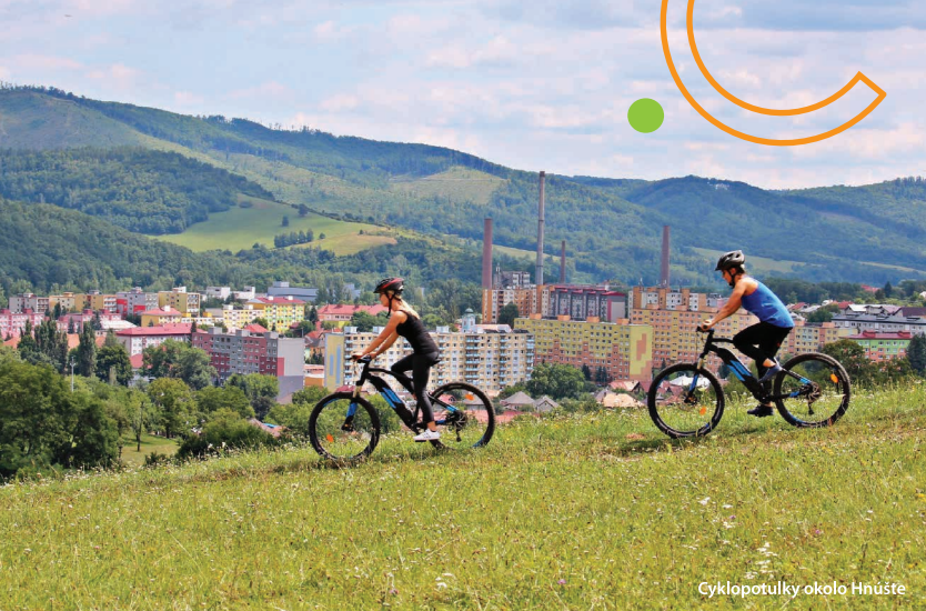
Cyklopotulky okolo Hnúšte