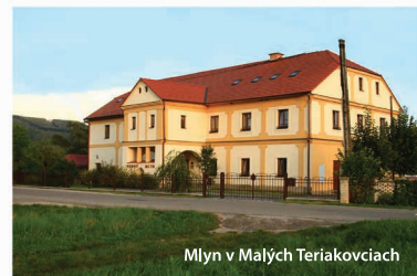
Mlyn v Malých Teriakovciach