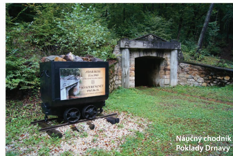
Náučný chodník Poklady Drnavy

Medzi klenoty horného Gemera určite patria aj kaštieľ s anglickým parkom v Betliari , hrad Krásna Hôrka (v rekonštrukcii) a mauzólem Andrássyovcov v Krásnohorskom Podhradí , prezývané aj „slovenský Taj-Mahal“.