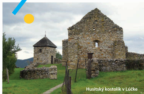
Husitský kostolík v Lúčke