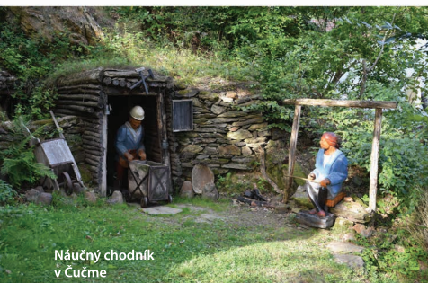
Náučný chodník v Čučme