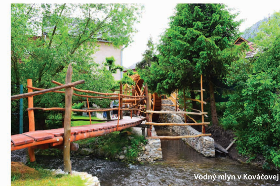
Vodný mlyn v Kováčovej