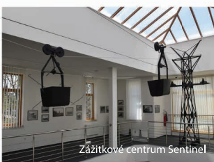
Zážitkové centrum Sentinel

Skvelou ukážkou baníckej histórie je aj náučný chodník v susednej obci ČUČMA , na ktorom nájdete ručne razené štólne – kresanice, alebo funkčnú repliku banského gápla . Odtiaľto sa po zelenej turistickej značke dostanete aj na Skalisko (1293 m n.m.), jeden z najvyšších bodov Volovských vrchov poskytujúci nádherné kruhové výhľady. Pod jeho vrcholom sa nachádza horská chata Volovec , v ktorej možno prenocovať počas celej letnej sezóny denne, mimo sezóny cez víkendy.