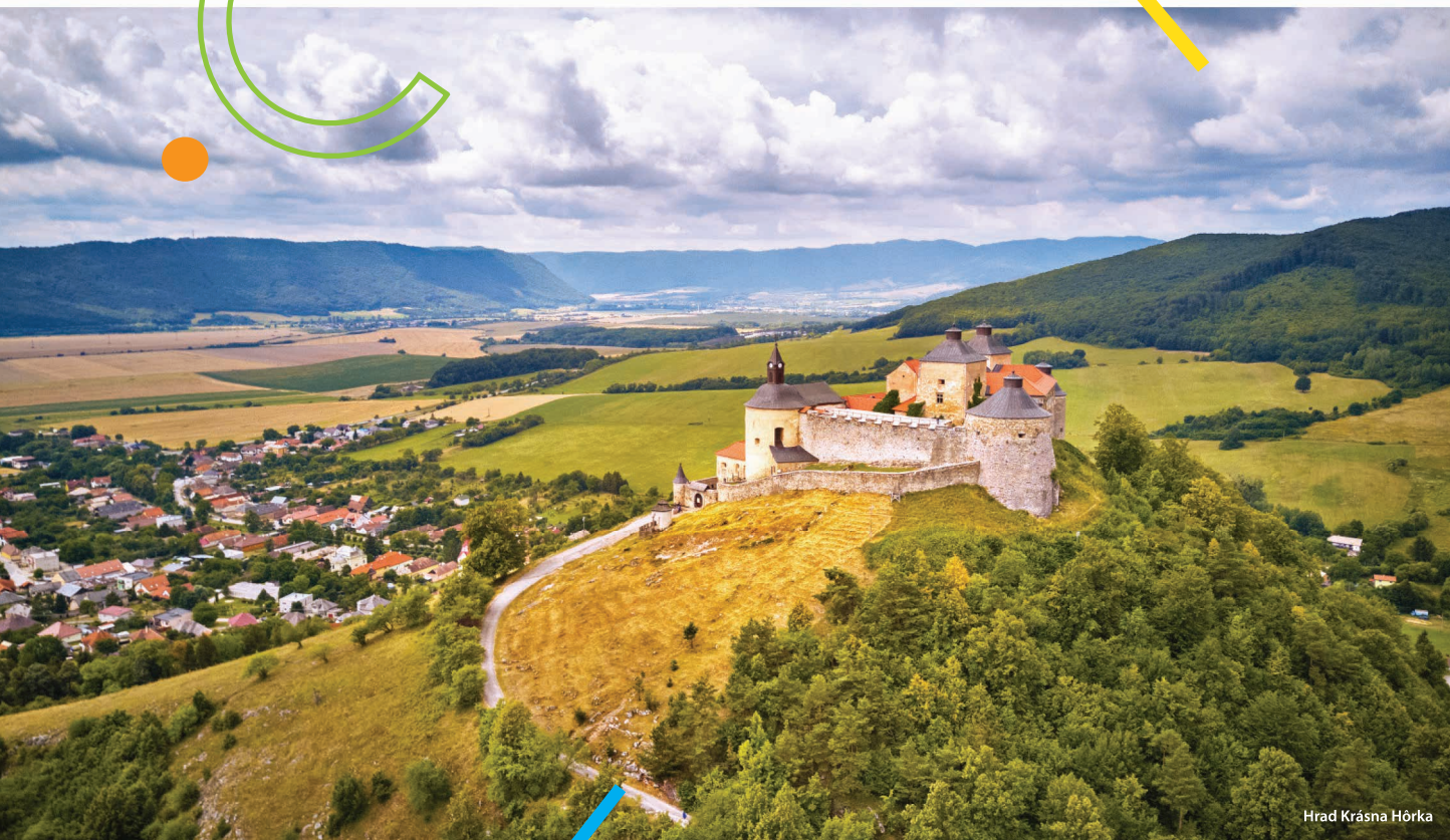
Hrad Krásna Hôrka