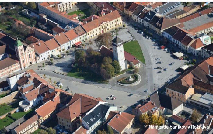
Námestie baníkov v Rožňave

ROŽŇAVA je centrom Horného Gemera. Jej minulosť je úzko spätá s ťažbou zlata, striebra, medi a železnej rudy. Z tohto obdobia pochádza jej názov Rosenau, odvodený od povesti o zlatej trojuhu.